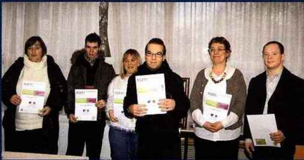
Nouveaux diplômés, les récipiendaires voient enfin reconnues leurs compétences professionnelles.

C' est une cérémonie inédite dans notre département qui s'est déroulée, dernièrement, sur le campus de l'afpa de Chevigny. Pour la première fois, en effet, six salariés d'établissements accueillant des publics du milieu du travail protégé, des entreprises adaptées, d'entreprises d'insertion, ou issus de l'éducation spécialisée, se sont vus remettre un portefeuille de compétences, lequel constitue, pour ces travailleurs pas tout à fait comme les autres, une véritable reconnaissance, en même temps qu'un authentique diplôme. »