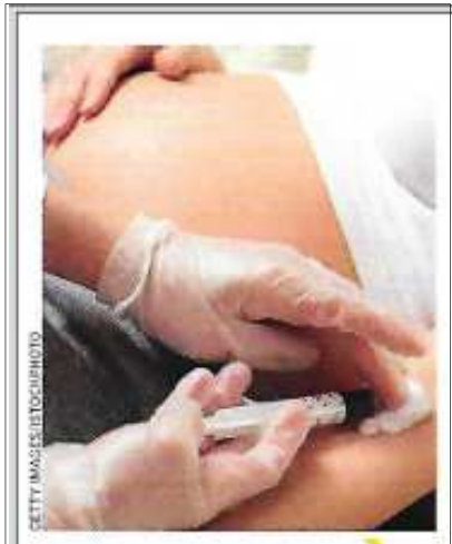
L'express 17/5/2017, p 22.