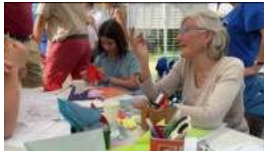
Compiègne 6 ème édition