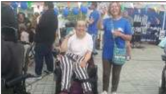
Saint-Brieuc 1 ère édition