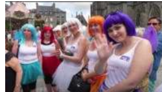
Quimper 1 ère édition